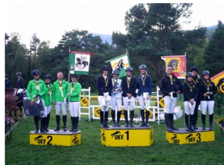
Der RV Werdenberg gewinnt die OKV-Vereinsmeisterschaft vor dem KV Hinterthurgau und dem RV Stammheimetal