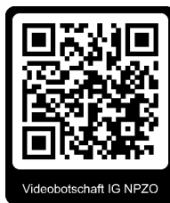
Videobotschaft IG NPZO

Unser Projekt auf einer A4-Seite darzustellen ist ziemlich schwierig, darum haben wir für euch eine kurze Videobotschaft aufgenommen; ihr findet diese via den nachstehenden QR-Code bzw. den Link.